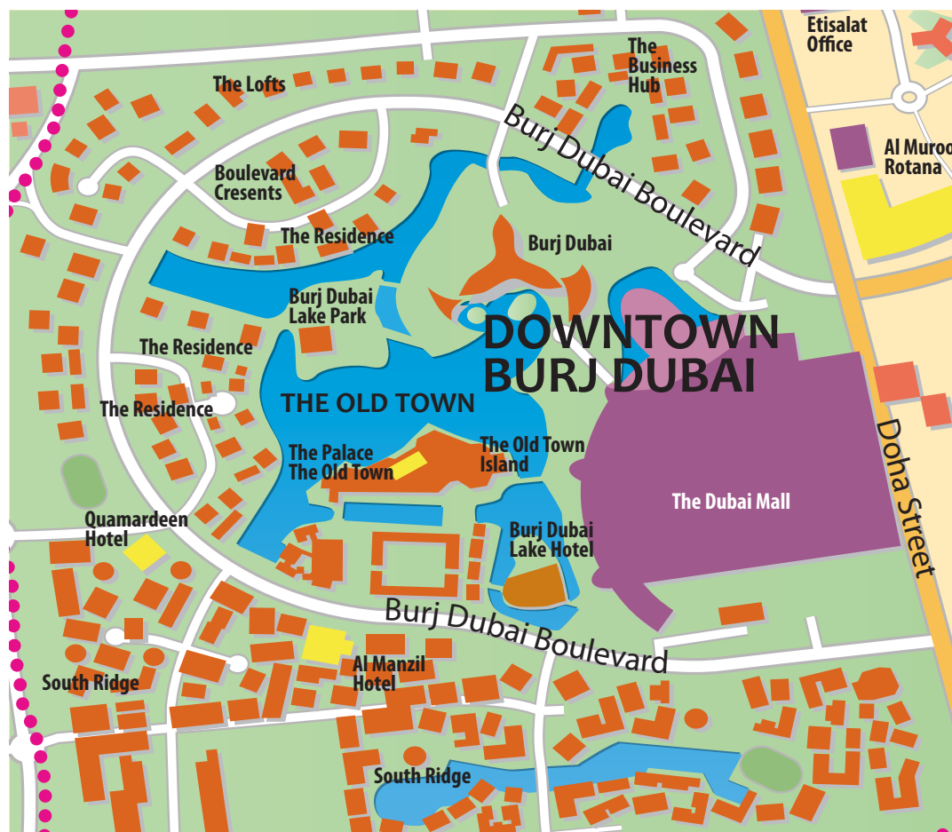
Сравнительная таблица рентного дохода от инвестиций в жилую недвижимость "фригольд" по основным районам Дубая. Декабрь 2009г.