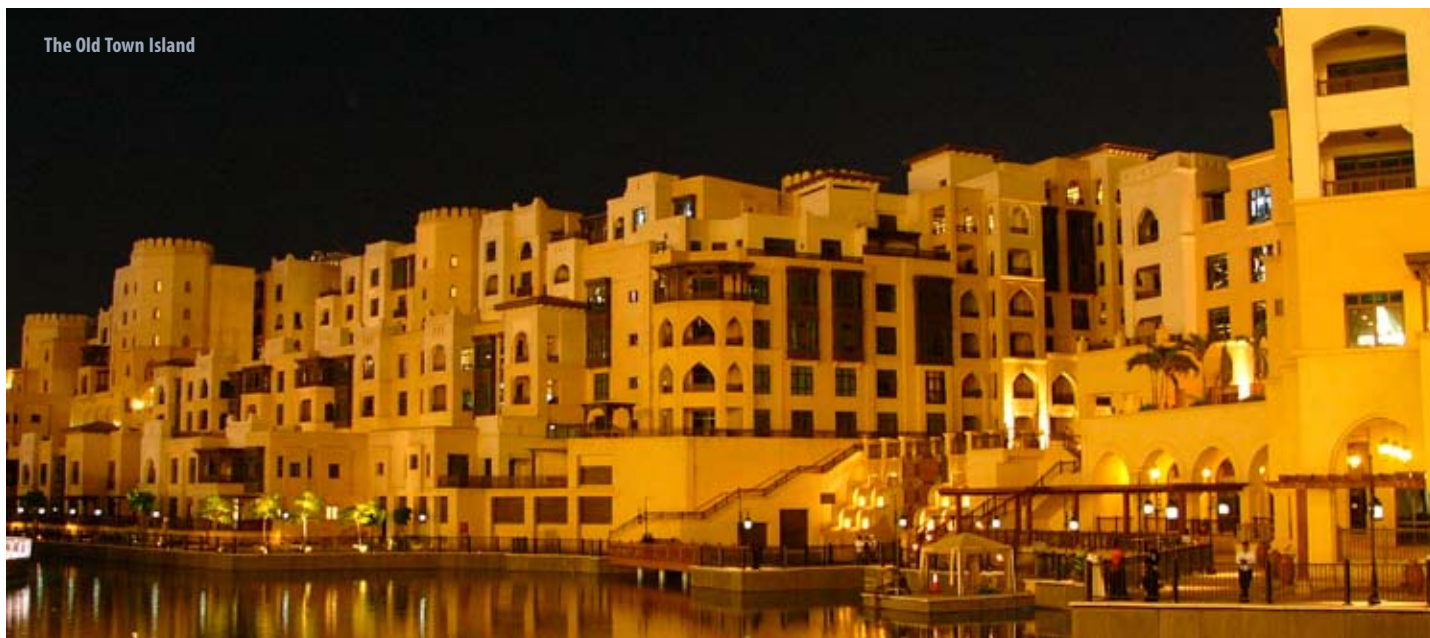
The Old Town Island