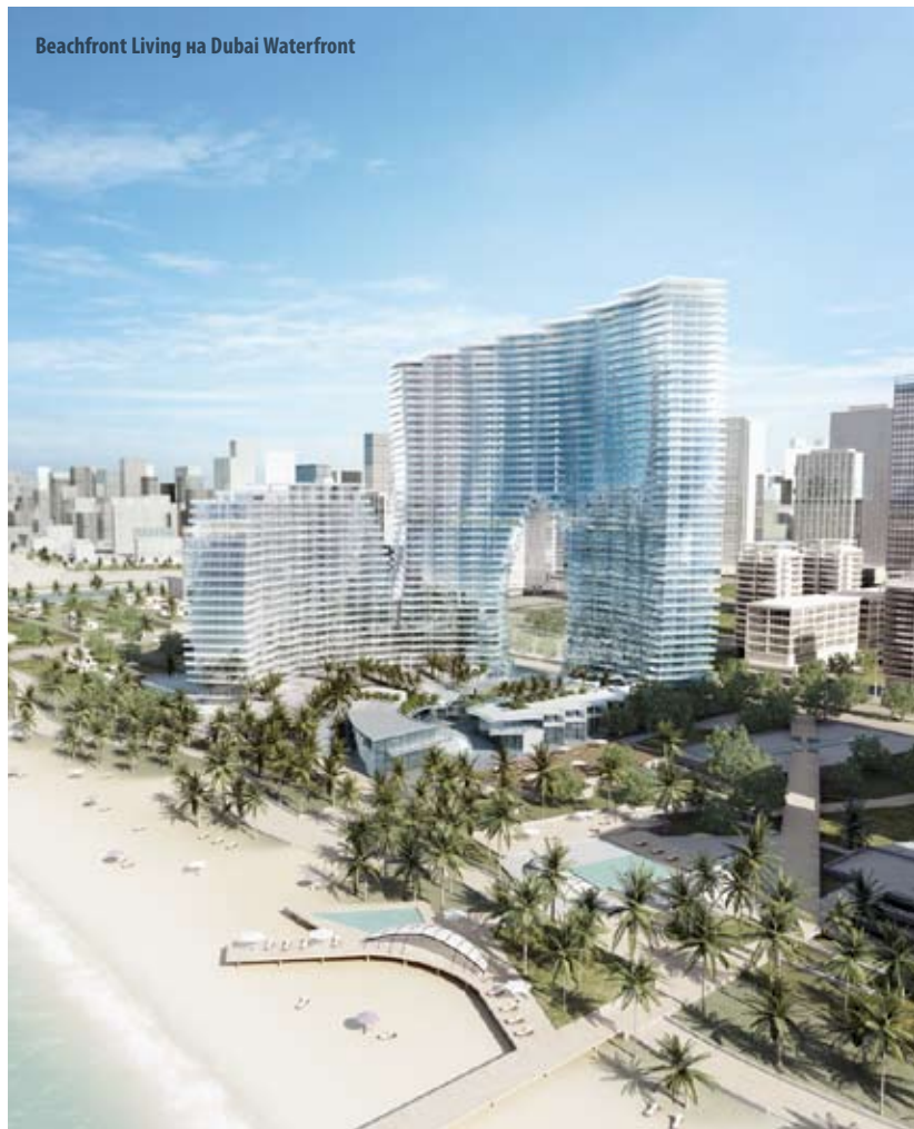
Beachfront Living на Dubai Waterfront

►► Вид из окон с северо-востока и до запада – на остров Palm Jebel Ali и открытое море. Так, у покупателей будет возможность приобрести квартиру с панорамным видом на море и закат с одной стороны, и на рукотворный остров Palm Jebel Ali – с другой.